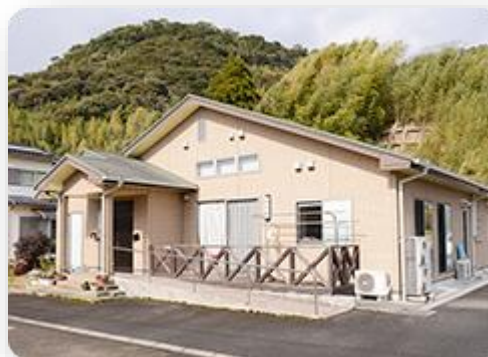
小規模多機能ホーム 協愛