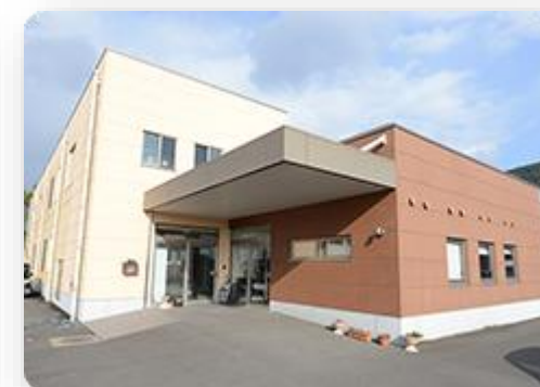
有料老人ホーム協愛